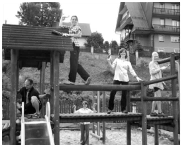
Prace społeczne na placu zabaw.