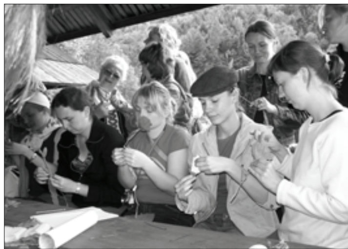
Warsztaty bibułkarskie.