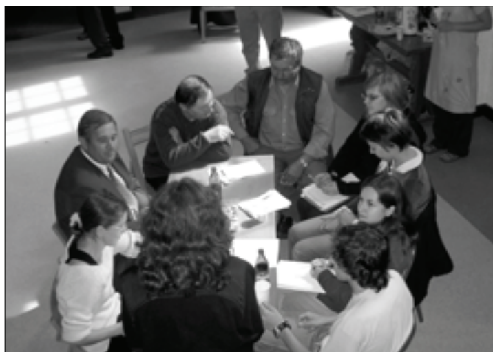
Podczas zajęć warsztatowych.